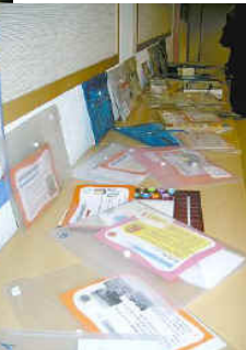
Übungswerkstatt „Deutsches Allerlei“