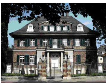
Geschichtsort Villa ten Hompel, Kaiser-Wilhelm-Ring 28, Münster