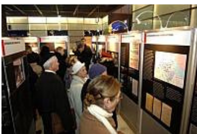
Ausstellung "Sonderzüge in den Tod" in Münster

In der Zeit vom 18. Mai - 15. Juni 2008 wird die Wanderausstellung der Deutschen Bahn AG mit ihrer lokal- und regionalhistorischen Erweiterung im Hauptbahnhof in Münster zu sehen sein. Schulklassen aus Bocholt sind herzlich eingeladen. Die Suwelack-Stiftung unterstützt den Besuch der Ausstellung mit Geldern für die Busfahrt!. Für weitere Informationen stehen wir jederzeit zur Verfügung!